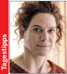
Bibiana Beglau spricht die Rolle der Kommissarin Jaqueline Hosnicz